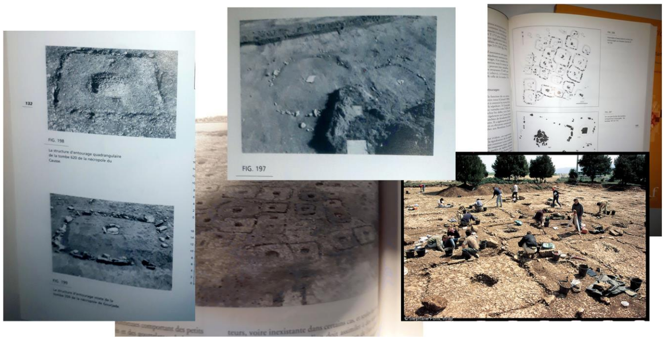
Figure 9- Photographie des fouilles des nécropoles du Tarn ( voir note 2) On peut constater la similarité d'aspect de ces structures et celles du Puy