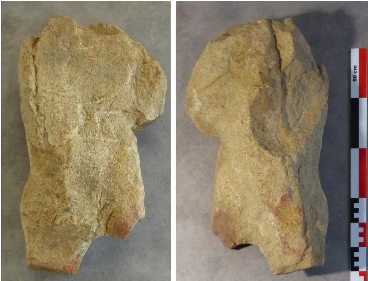
Figure 10- : Torse en granit -47cm - Face avant - Face arrière

Le plus spectaculaire est un torse en granit de 47 cm de haut et pesant 16kg.