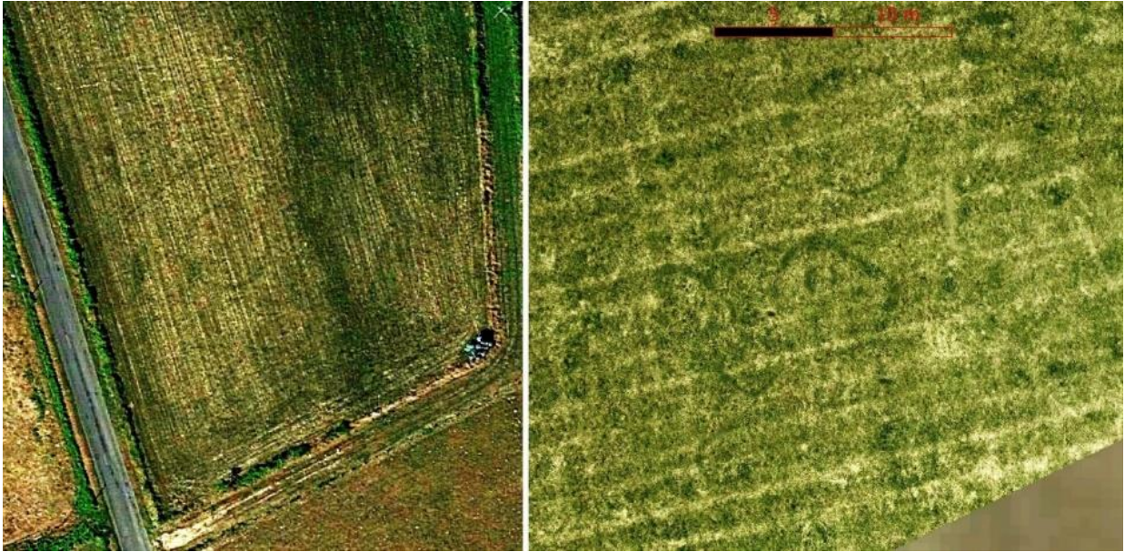
Figure 5- : Le Boislaroussie Structures circulaires décimétriques et métriques (Images Google Earth 2018 et photo par drone 2024 (YD))