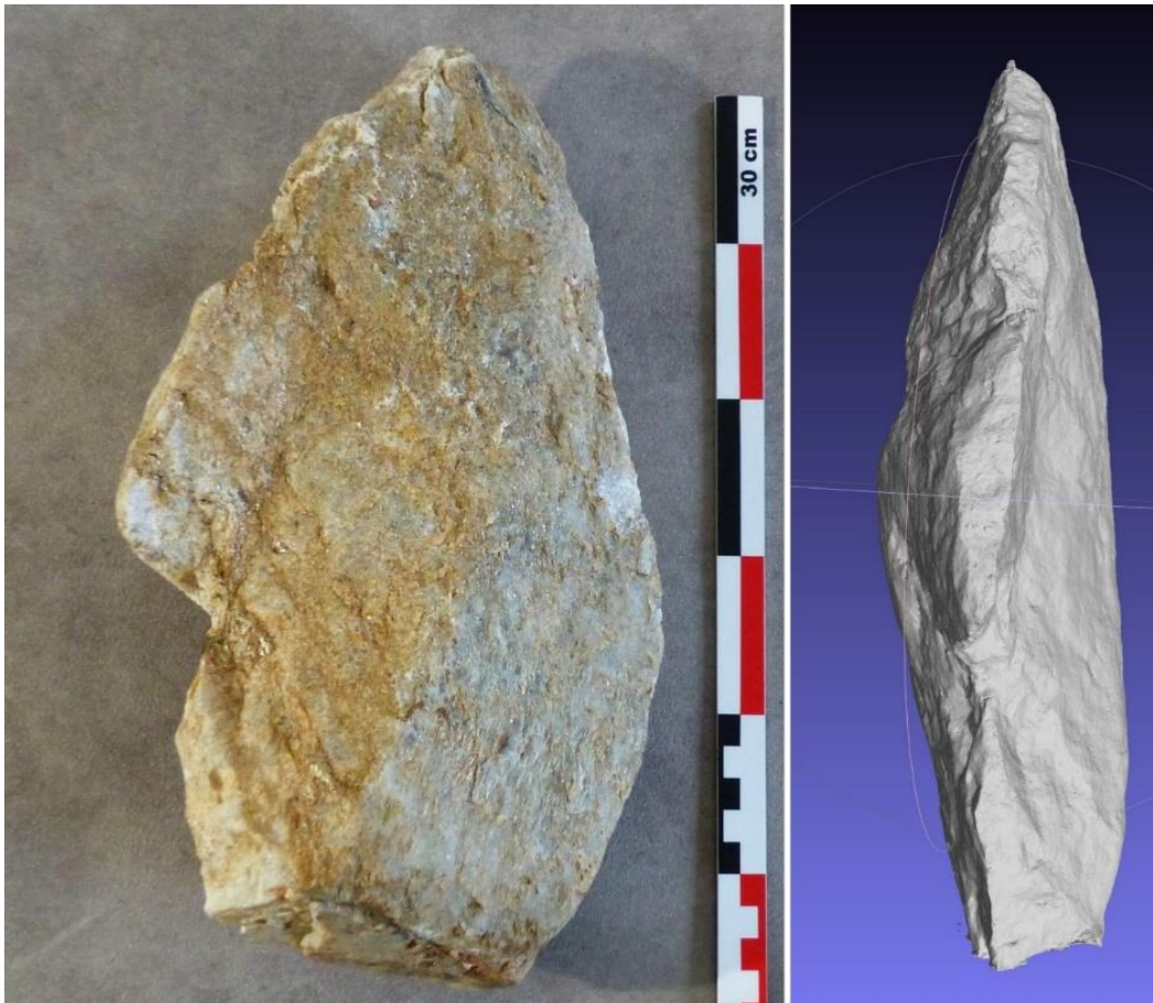
Figure 13- : Lame de quartz #1 -29 cm - Face et profil –