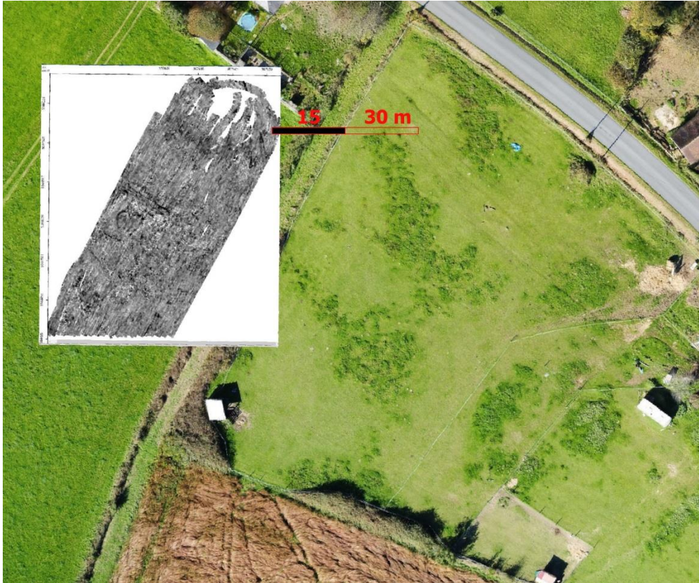
Figure 7 -Image par drone montrant de possibles structures carrées dans la prairie, à proximité du fanum(?) détecté par Géoradar.