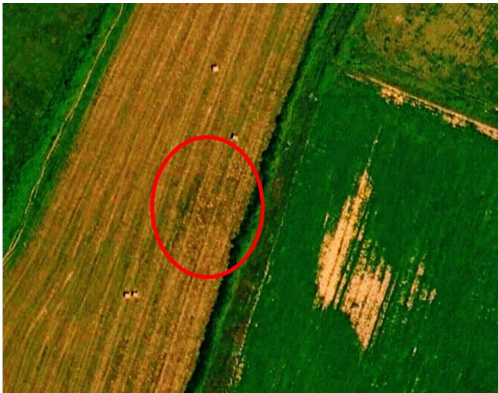
Figure 8 - Le Boislaroussie - Structure dans un champ