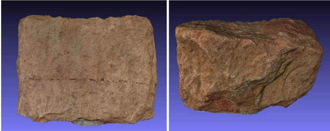
Fig5 : Pierre en granit décorée – Faces avant et arrière – Largeur 13 cm