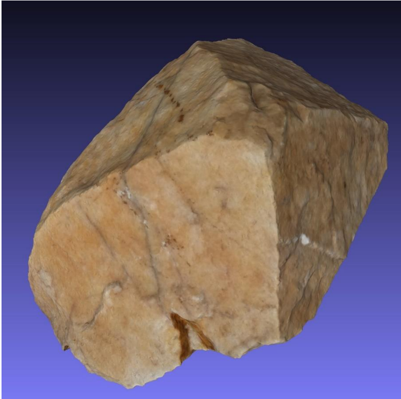
Figure 12- : Pyramidion en quartz L < 21\text{cm} - Restes de décoration brune

Dans deux parcelles distinctes on a trouvé des lentilles de quartz découpées, qu'il est difficile d'interpréter.