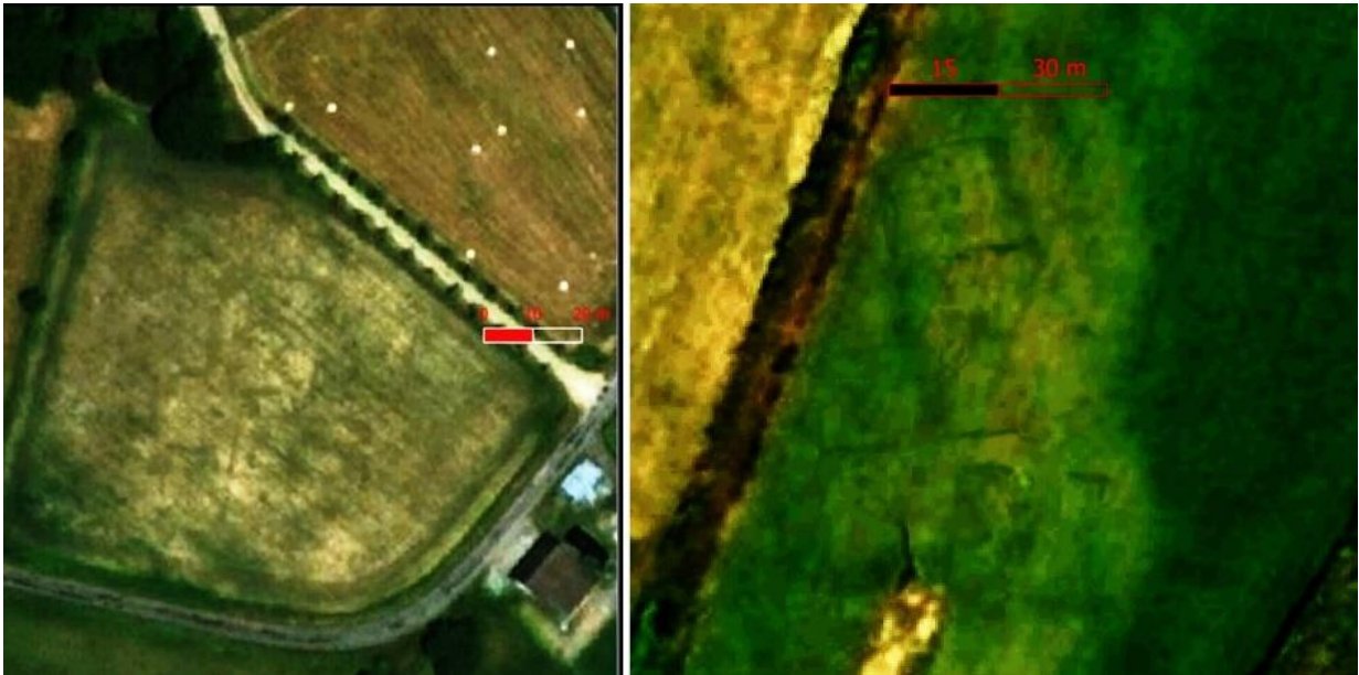
Figure 4 - : Le Peyrateau - Structures carrées-centrées- Fosses cinéraires ? ( Images Satellite WP)

L'examen des vues aériennes de la zone suggère la présence d'un site archéologique relativement étendu. Tout le long de la route sur plus d'1,5 km on peut repérer des grands cercles mesurant jusqu'à 20m de diamètre, un grand nombre de structures carrées centrées de 1 à 10m de côté, plus ou moins visibles. Une courte campagne de Géoradar réalisée avec le SRA de Limoges a mis en évidence une structure qui serait peut-être un fanum. En l'absence de fouilles pour le confirmer, les structures carrées évoquent en première approche des sites funéraires à incinération protohistoriques et antiques. Les guirlandes de structures évoquent notamment celles des nécropoles de la région de Castres 2 .