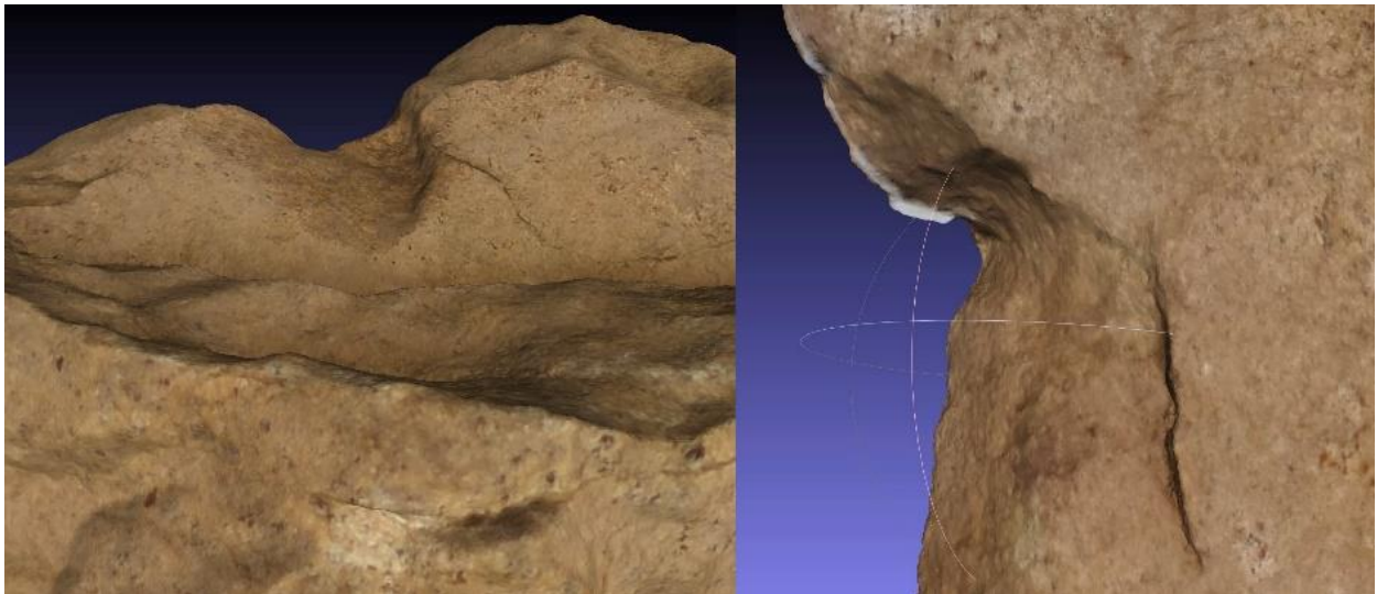
Figure 14- Encoches au col et à la hanche du torse en granit.

Il est plausible que la face avant, aujourd'hui lisse et nue, n'ait jamais été sculptée mais décorée avec des tracés linéaires du même type que ceux présents sur la pierre parallélépipédique.